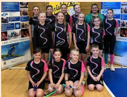
Rope skipping ALCEDO Vsetín